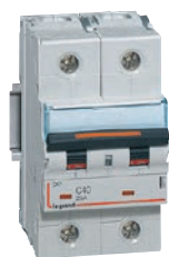
4 097 72

автоматические выключатели с термомангнитными расцепителями на токи от 2 до 125 А