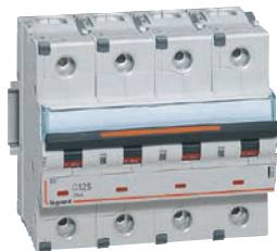
4 098 03