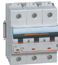
4 098 33