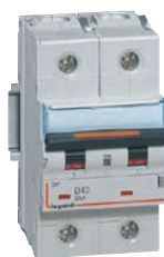
4 098 24