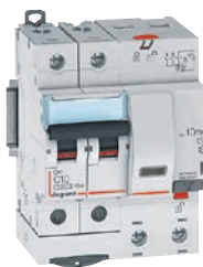
4 111 49