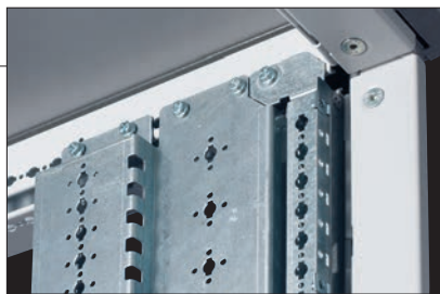
0 211 37

Состав комплекта (вариант): - верхняя панель и основание шкафа Кат. № 0 211 35 - опорные стойки Кат. № 0 211 36 - монтажные стойки Кат. № 0 211 37 - задняя панель Кат. № 0 211 41 - рама для крепления лицевых панелей Кат. № 0 208 55 - рым-болты Кат. № 0 205 82