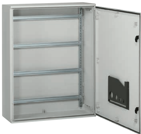
Полиэстеровые шкафы Marina