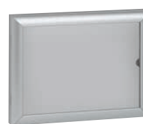
0 475 45