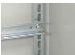
0 367 84 с клипсо-гайками 0 364 42 + винты 0 367 75