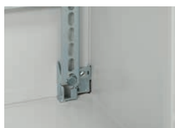
0 361 55