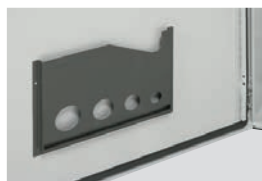
0 365 80