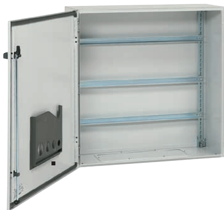
Металлические шкафы Atlantic