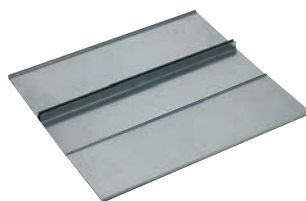
0 481 82+0 481 78