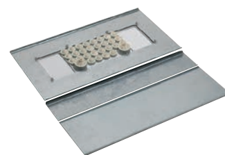
0 481 74+0 481 79