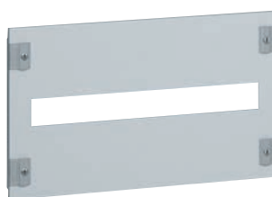
0 203 10