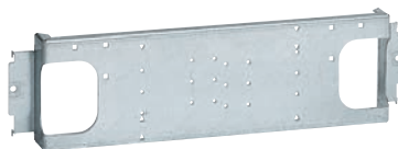
0 202 13