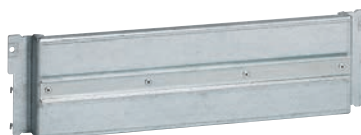
0 202 11

оборудование для монтажа DPX 3 160, DPX 3 250 и DPX-IS 250 на монтажную плату