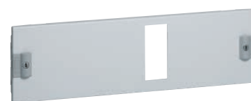
0 203 13