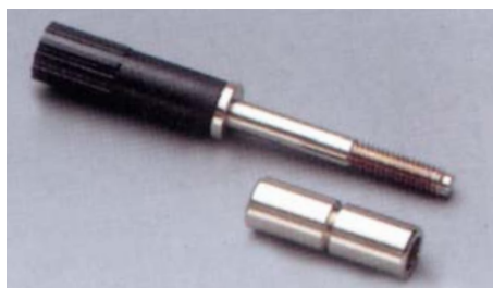
Винт + рукав