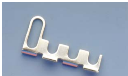
4-полюсная перемычка типа SCX/PO/4