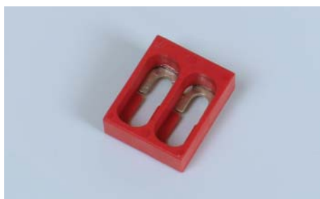
2-полюсная перемычка типа SCB/4; HSCB/6