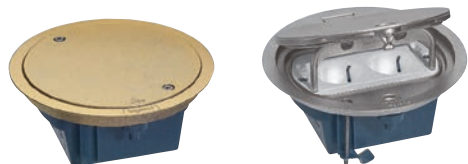
0 880 60