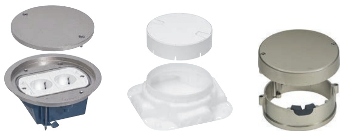
0 880 61 с механизмами Mosaic