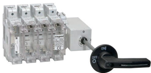
6 051 10+6 051 23