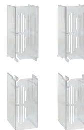
6 051 33

Технические характеристики и размеры стр. 158-159