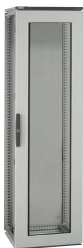
0 473 62