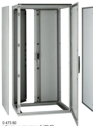
0 473 60 с боковыми панелями 0 472 72