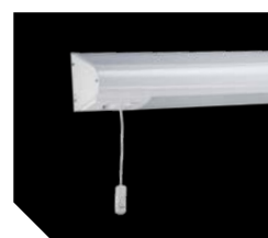
ВН 236 с кнопкой вызова (левосторонний)